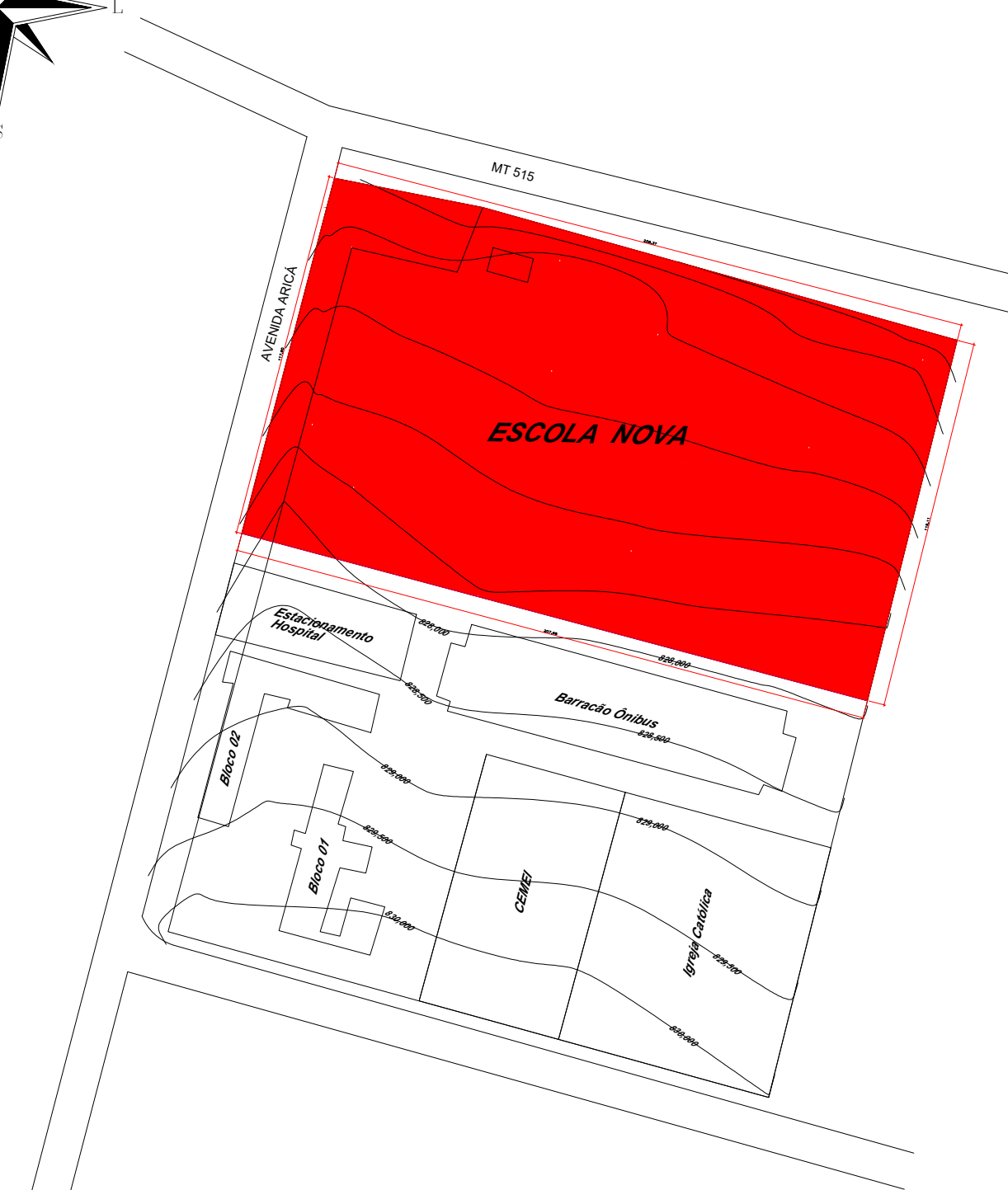
PLANTA DE SITUAÇÃO ESCALA Escala Gráfica: 1:2000